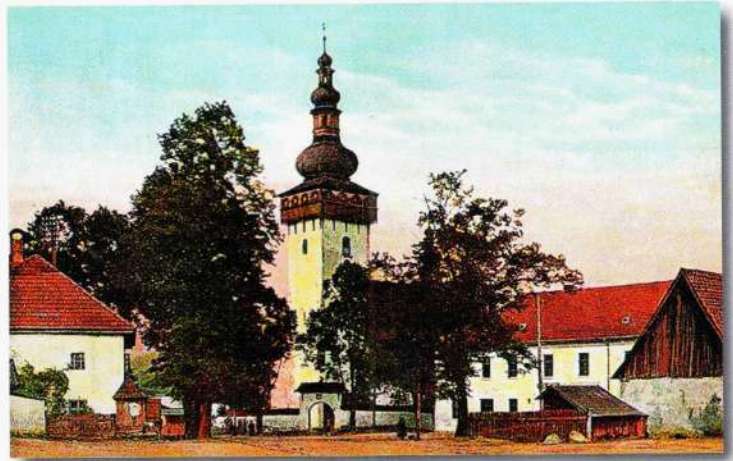
Námestie v Handlovej s kostolom svätej Kataríny (pred 100 rokmi)

Ťažba drahých kovov neprebíhala len v baniach, ale aj povrchovo. Ako podľa teba prebiehala povrchová ťažba? Kde mohli ľudia nájsť napríklad zlato?