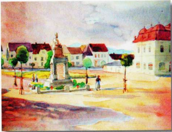
Námestie v Nitrianskom Pravne (okolo roku 1930)

Akýsi prechod medzi pravnianskou oblasťou a kremnickou oblasťou predstavuje Handlová, založená roku 1367. Bola najväčšou nemeckou obcou Hauerlandu.