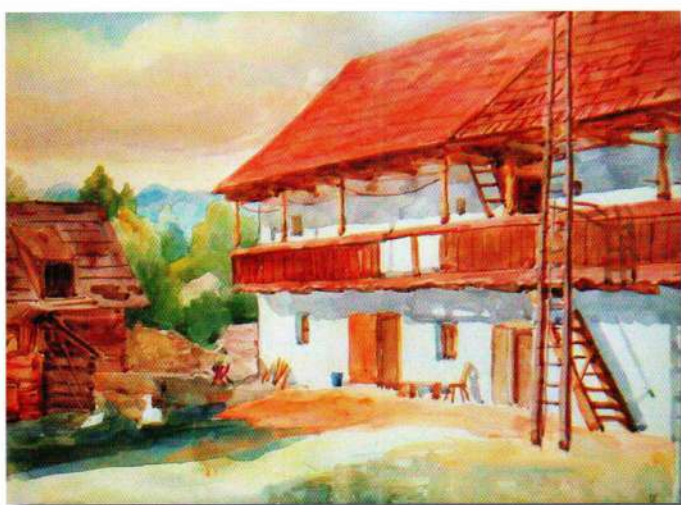
Typický nemecký poschodový dom v kremnickej oblasti

Pre rozmach nemeckého osídlenia malo mimoriadne veľký význam udelenie mestských privilégií Kremnici v roku 1328. Stala sa sídlom kráľovskej komory s právom razenia mincí. Po udelení privilégií nastal prudký rozvoj mesta. Popri banských odborníkoch sem prichádzali i remeselníci, obchodníci a podnikatelia. V Kremnici sa razili dukáty, ktoré patrili k najhodnotnejším menám v celej Európe, keďže sa vyznačovali vysokou rýdzosťou zlata alebo striebra.