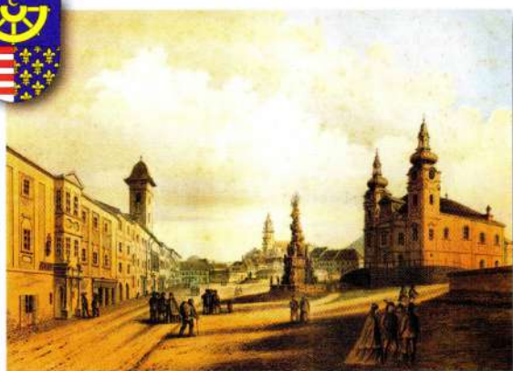
Kremnica v polovici 19. storočia

Pokús sa priradiť k týmto mestám ich nemecký názov: